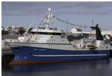
Guðmundur í Nesi

Skipaskr.nr. 2626 IMO nr. 9235438 Smíðaður: Tomrefjord Noregi 2000, stál Stærð: 1315 brl. 2464 bt. Mesta lengd: 66 m Skráð lengd: 59,43 m Breidd: 14 m Dýpt: 8,67 m Vél: Wärtsilä 5520 kW, 2000 Fjöldi skipverja: 18