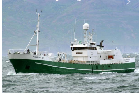
Páll Jónsson

Skipaskr.nr. 1030 IMO nr. 6704892 Smíðaður: Hollandi 1967, stál Stærð: 299 brl. 402 bt. Mesta lengd: 43,90 m Skráð lengd: 40,36 m Breidd: 7,60 m Dýpt: 6,30 m Vél: Grenaa 662 kW, 1981 Fjöldi skipverja: 14