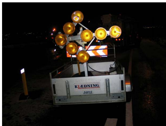
Blikkljós á stefnuör blikkuðu ekki. Dautt var á rafgeymi.

Þegar slysið varð var myrkur, þungskýjað og yfirborð Reykjanesbrautarinnar blautt, snjókrapi úti við kanta og hált. Hálsa er þó ekki talin vera þáttur í slysinu. Götulýsing var virk að hluta á báðum akreinum, þó ekki við beygjuna þar sem slysið varð.