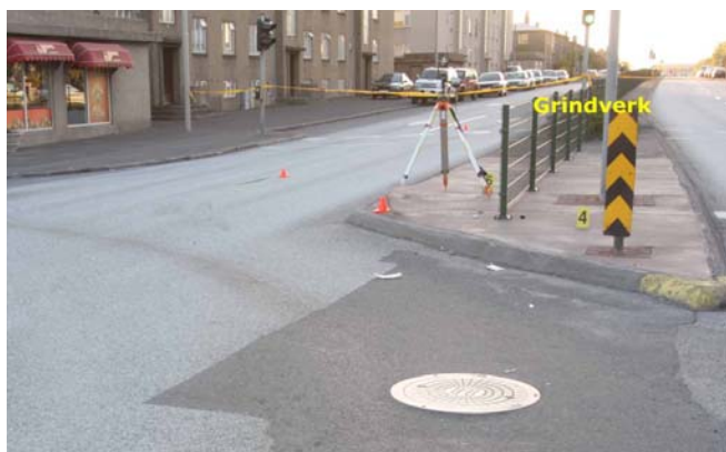
Mynd 2. Grindverk á miðeyju skerðir útsýni vestur Hringbraut

gangandi vegafarendur þveri Hringbraut á öðrum stöðum en við gangbrautarljósinn. (sjá mynd 2).