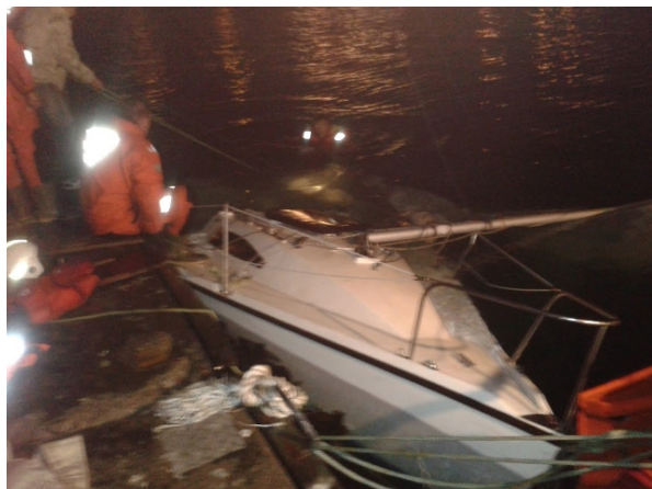
Día eftir að hún var dregin að bryggju

Krusað var suður leiðina á milli Suðurness og Kerlingaskers en skömmu eftir að vent var í sundinu á milli Kerlingaskers og Kepps lagðist báturinn, þrátt fyrir að búið væri að rifa seglin verulega, svo mastur fór í sjó. Formaður sem komst upp á síðuna sá að neðri hluti kjalar var horfinn og efri hluti hans verulega sprunginn og „jagaðist hann til“. Brotnaði hann af skömmu síðar. Hvolfdi þá bátinum endanlega og komst formaðurinn upp á botninn.