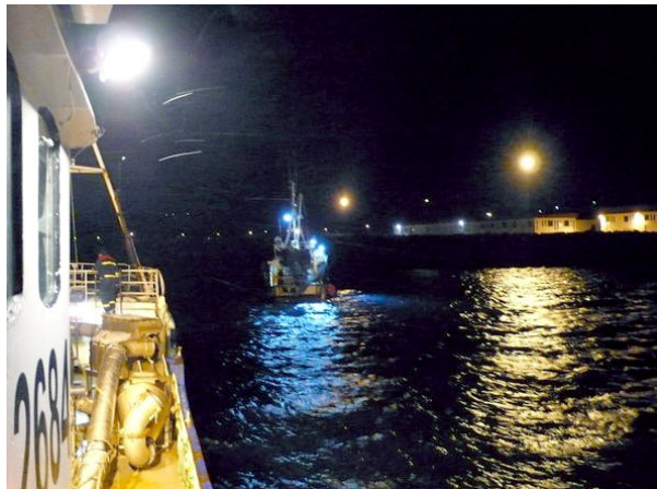
Papey 2684 dregur Val ÍS af strandstað

Bátsverjar fóru í björgunarbúninga og athuguðu með leka sem ekki var til staðar.