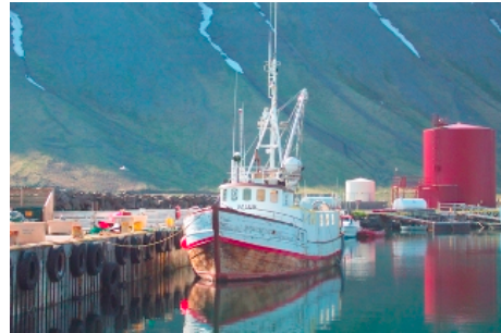
Valur