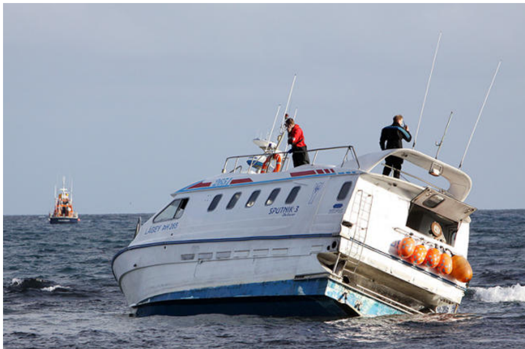
Lágey á strandstað

Björgunarskipið Sigurvin frá Siglufirði kom á staðinn kl. 07:40 og var búið að koma dráttartaug í Lágey PH kl. 08:00.