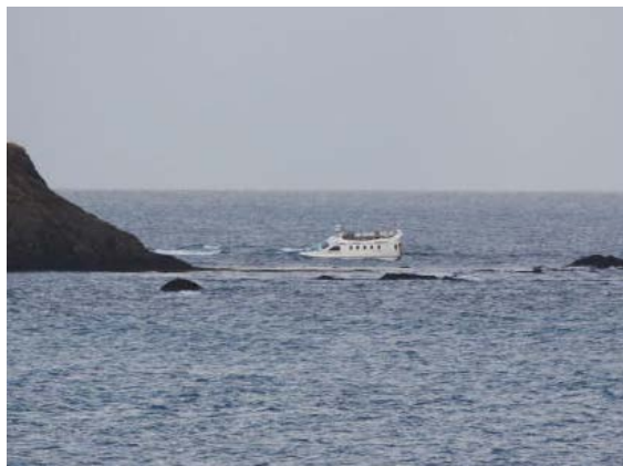
Lácey á strandstað

Kl. 10:17 var haldið aftur á miðin og lokið við að draga línuna. Kl. 18:30 var farið inn á Kópasker en strax út aftur. Kl. 22:40 hafði báturinn stutta viðkomu á Kópaskeri þar sem tveir af áhöfninni fóru í land áður en haldið var áleiðis til Húsavíkur.