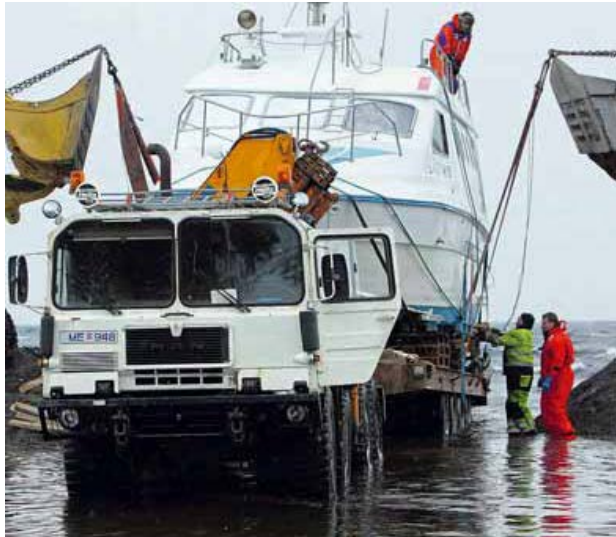
Lágey komin á bíl

Ákveðið var að létta bátinn og voru veiðarfæri, afli og megnið af olú tekið úr honum. Björgunarskipið Sigurvin reyndi kl. 09:30 að draga Lágey ÞH á flot en það gekk ekki. Var björgunaraðgerðum hætt í bili og tryggingafélagi bátsins látinn eftir vettvangurinn. Lágey ÞH var síðar tekin úr fjörinni með því að hífa hana á bifreið. Var hún þá u.þ.b. 15-16 tonn að þyngd.