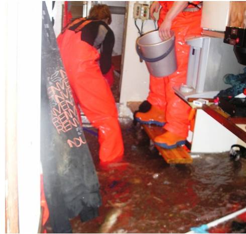
Unnið að hreinsun