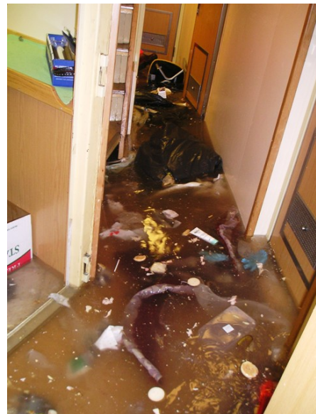
Sjór í íbúðum

Tveir skipverjar voru að ganga frá afla í lest skipsins þegar brotsjóirnir lentu á skipinu. Köstuðust þeir til og tóm fiskikör fóru af stað og lentu á þeim. Þeir slösuðust lítilsháttar. Ákveðið var að sigla til Skagastrandar.