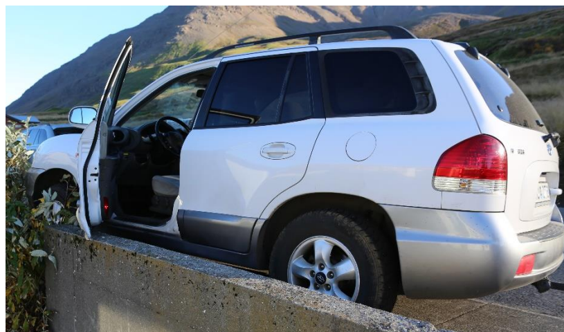
Mynd 2: Bifreiðin þar sem hún stöðvaðist upp við garðvegginn. Þarna er búið að lyfta henni, opna hurðina og losa ökumanninn.

Bifreiðin var af gerðinni Hyundai Santa Fe, árgerð 2006. Við skoðun á bifreiðinni kom ekkert í ljós sem skýrt gæti orsök slyssins. Hemlar og stýrisbúnaður voru í lagi sem og gírskipting. Bifreiðin rann á lítilli ferð niður götuna og upp á gangstétt.