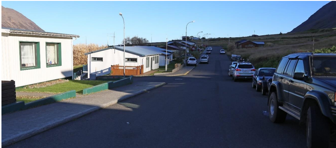
Mynd 1: Mynd tekin í akstursátt bifreiðarinnar af vettvangi slyssins.

Snemma að morgni föstudagsins 14. október 2016 stöðvaði ökumaður bifreið sína er hann var að bera út dagblöð á Hlíðarvegi á Ólafsfirði. Hann hafði stigið út úr bifreiðinni, skilið hana eftir í gangi án þess að setja hana í handbremsu eða stöðugir (P). Bifreiðin var sjálfskipt. Þar sem bifreiðin stóð hallaði vegurinn niður og rann hún af stað. Svo virðist af ummerkjum að dæma og framburði vitna að ökumaðurinn hafi hlaupið á eftir bifreiðinni og teygt sig inn um öikumannshurð til að stöðva bifreiðina. Bifreiðin rann upp á gangstétt og klemmdist maðurinn á milli hurðar og hurðarstafs þegar bifreiðin rann á 45 cm háan steiptan garðvegg. Bifreiðin rann sennilega um 40 metra áður en hún stöðvaðist á garðveggnum. Ásamt ökumanni var einn farþegi í bifreiðinni. Hann sakaði ekki í slysinu.