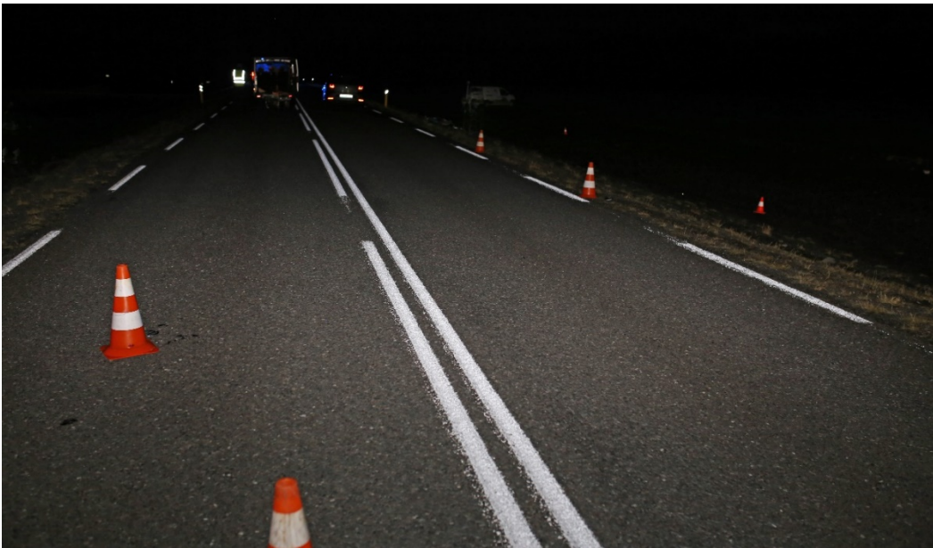
Mynd 1: Mynd tekin í akstursátt Polo bifreiðarinnar.

Að kvöldi 17. september 2016 var 9 manna hópur erlendra ferðamanna ásamt erlendum leiðsögumanni sínum á vesturleið um Suðurlandsveg á tveimur bifreiðum. Það var myrkur og vestlægur vindur um 10 m/s. Til móts við veginn niður á Sólheimasand var bifreiðunum lagt norðan Suðurlandsvegur og samkvæmt ferðamönnunum steig leiðsögumaðurinn út úr bifreiðinni til að líta til vegar. Á sama tíma var Volkswagen Polo bílaleigubifreið ekið vestur Suðurlandsveg. Auk ökumanns var einn farþegi í framsæti og var hann sofandi, báðir erlendir ferðamenn. Skyndilega sá ökumaðurinn mann standa við veginn og tveimur til þremur sekúndum seinna sá hann annan mann standa á veginum og snúa baki í akstursstefnu bifreiðarinnar. Var það staðfest við rannsókn málsins. Kvaðst ökumaðurinn hafa hemlað en ekki náð að sveigja frá og ekið á manninn. Maðurinn lenti vinstra megin á vélarhlíf bifreiðarinnar, kastaðist síðan af bílnum og út fyrir veg. Við slysið hlaut hann banvæna fjörláverka. Hinn látni var í bláum vindjakka yfir svartri peysu og í svörtum buxum. Engin endurskinsmerki voru á fatnaðinum.