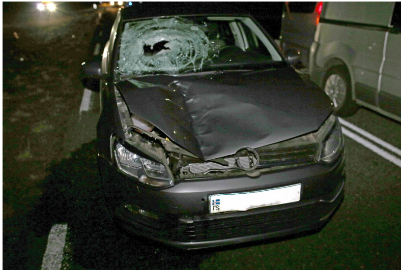
Mynd 2: Polo bifreiðin á slysstað.