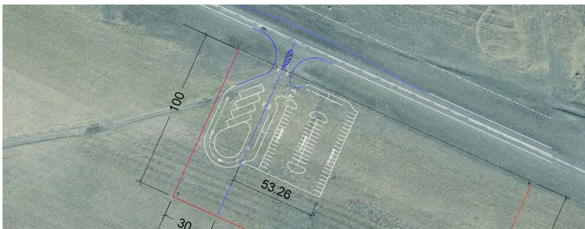
Mynd 3: Teikning af bílastæði og vegamótum inn á þau, bílastæði var útbúið eftir slysið og vegamót lagfærð. Teikning fengin frá Vegagerðinni.

Á slysstað liggur vegurinn beinn og er óupplýstur. Slóði liggur suður Sólheimasand á þessum stað. Hann er afar vinsæll hjá ferðamönnum sökum flugvélarfylks sem þar er að finna skammt frá. Eftir slysið var leyfður hámarkshraði á þessum vegarkafli tímabundið lækkaður niður í 70 km/klst þar til útbúið hafði verið bílastæði sunnan við þjóðveginn og vegamót inn á þau lagfærð. Sjá mynd að neðan.