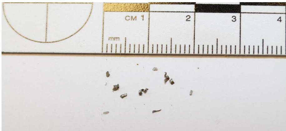
Mynd 4: Agnir sem fundust í mælistykki