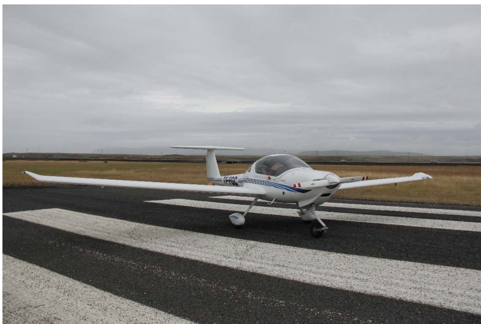
Mynd 1: TF-FGC á flugvelliinum við Sandskeið

Áætlað var að gera æfingar í Austursvæði og þegar þangað var komið ákvað flugkennarinn að hækka flugið í 2500 feta hæð sökum hækkandi landslags. Þegar flugvélin var í klifri og í um það bil 2200 feta hæð varð flugkennarinn var við að hljóð frá hreyflinum var ekki eðlilegt. Hann gaf þá hreyfilmælum gaum en sá ekkert athugavert. Flugvélin var þá stödd við Litlu kaffistofuna og beindi flugmaðurinn henni í átt að flugvelliinum við Sandskeið til þess að vera nær heppilegum landingarstað ef ástand myndi versna. Skömmu síðar sýndi snúningsmælirinn lækkun á snúningshraða hreyfils og eftir 10-15 sekúndur stöðvaðist hreyfillinn. Flugkennarinn lýsti þá yfir neyðarástandi, fyrst á tíðni landsbylgju (118.1) og síðan á tíðni turnbylgju (118.0) og nauðlenti flugvélinni til vesturs á flugvelliinum við Sandskeið. Engan sakaði og engar skemmdir urðu á flugvélinni.