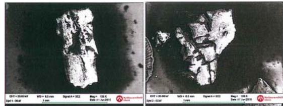
Mynd 5: Myndir af ögnum