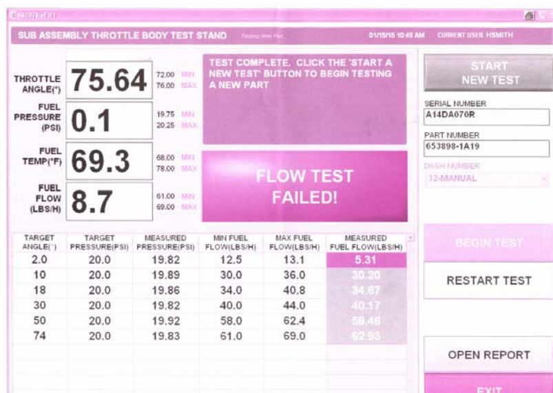
Mynd 2: Niðurstöður prófana á mælistykki

Eftir atvikið við Sandskeið var eldsneytiskerfi flugvélarinnar skoðað ítarlega ásamt kveikibúnaði. Hluti eldsneytiskerfisins var sendur til prófunar hjá framleiðanda, þ.e. eldsneytisdæla, deilir (ásamt eldsneytISRörum) og mælistykki (Meetering unit), sem ákvarðar eldsneytisflæði og loftflæði til hreyfilsins (sjá viðauka). Við prófanir kom fram að eldsneytisdæla og deilir störfuðu eðlilega en eldsneytisflæði um mælistykkið var undir tilætluðum mörkum þegar eldsneytisgjöfin var nálægt hægagangi. Enn fremur mældist það við lægri mörk á öðrum stillingum (sjá mynd 2).