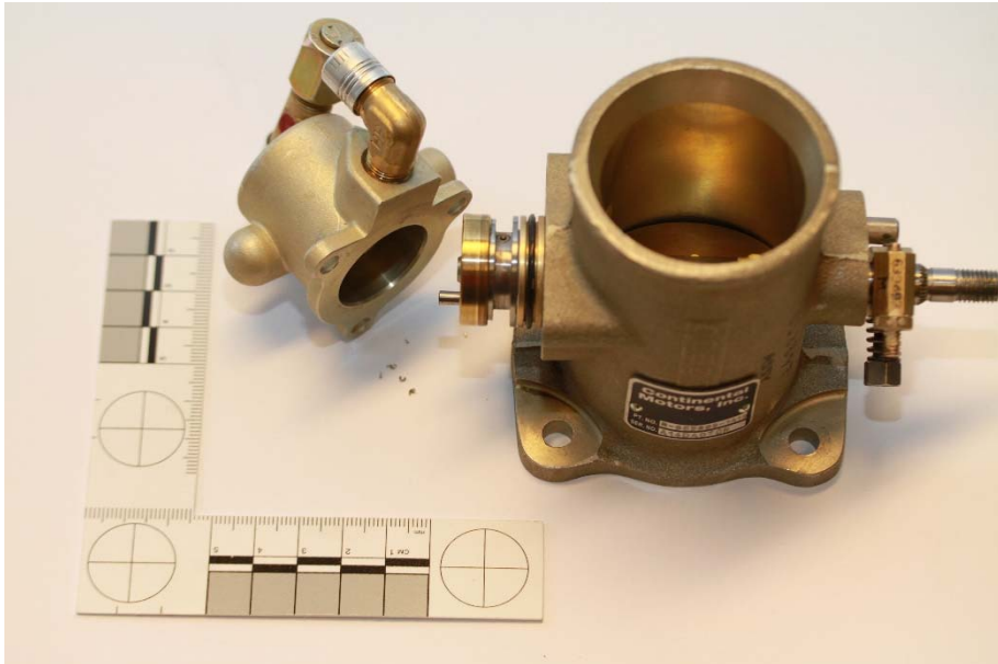
Mynd 3: Mælistykki opnað

Eftir stillingu á mælistykkinu stóðst það prófun en virtist þó starfa áfram við lágmörk. Við nánari rannsókn á mælistykkinu fundust agnir í eldsneytishólfi þess. Agnirnar voru nægilega stórar til þess að loka fyrir eldsneytisflæði um stund. Líklega hefur það gerst af og til.