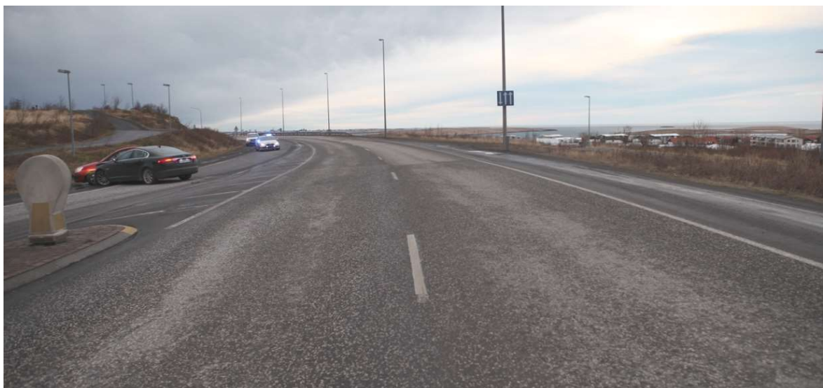
Mynd 2: Mynd frá lögreglu tekin á Vesturlandsvegi í átt að Reykjavík. Kia bifreiðin var staðsett á hægri vegöxl þegar henni var ekið af stað í vinstri beygju þvert yfir akgreinarnar.

Ökumaður Jaguar bifreiðarinnar lýsti því svo að hann hafi ekki haft svigrúm til að forða árekstri. Framburður annara vegfarenda styður þessa lýsingu hans.