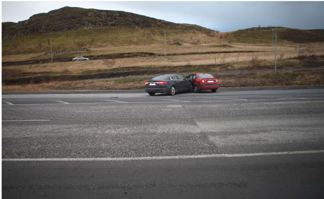
Mynd 3: Mynd frá lögreglu tekin frá vegöxlinni þar sem ökumaður Kia bifreiðarinnar hafði stöðvað fyrir áreksturinn. Myndin en tekin í átt að Lágafelli og sýnir hvar bifreiðarnar stöðvuðust eftir áreksturinn.

Á vettvangi eru þrjár akreinar, tvær fyrir umferð á leið til Reykjavíkur og ein fyrir umferð í gagnstæða átt. Skammt austan við árekstrarstað er umferðareyja og í framhaldi af henni er merkt bannsvæði með óbrotnum línunum þar sem ekki er gert ráð fyrir umferð ökutækja. Bannsvæðið nær um 75 metra út frá umferðareyjuni. Í framhaldi af bannsvæðinu er tvöföld óbrotin lína milli akstursátta.