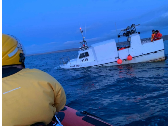
Mynd 2 Mikill leki var að bátnum

Um kl. 03:50 var björgunarbátur frá björgunarsveitinni Húnum kominn að Mars. Kl. 04:06 fór þyrila LHG TF-LIF í loftið. Á mynd 2 má sjá hvernig ástandið var á Mars þegar björgunarsveitin kom á staðinn.