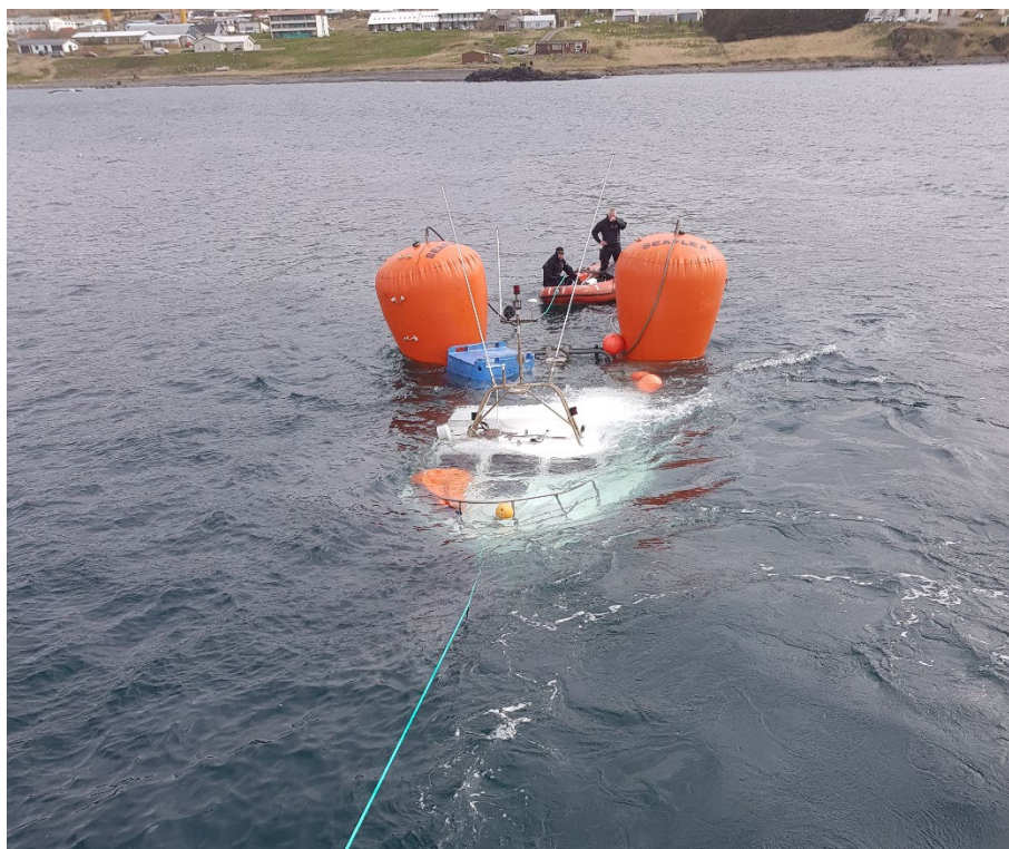
Mynd 4 Mars tekinn upp á yfirborðið

Bátnum var síðar lyft upp með belgjum og dreginn til hafnar þar sem hann var hífður á land. Þá komu í ljós skemmdir á stefni bátsins. Sjá myndir 4 og 5.