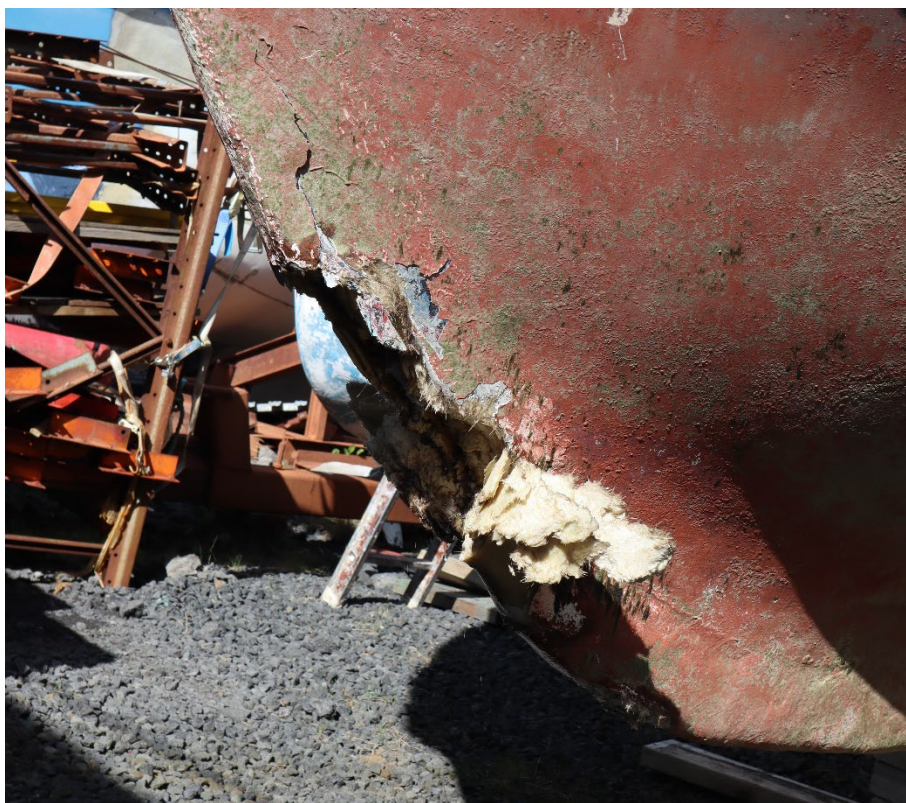
Mynd 5 Skemmdirnar á stefninu