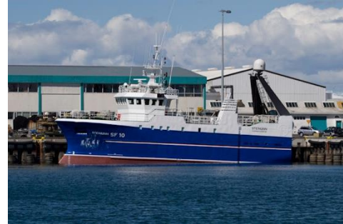
Pálína Þórunn

Skipaskr.nr. 2449 IMO; 9226475 Smíðaður: Kína, 2001, stál Útgerð: Nesfiskur ehf. Stærð: 327,62 BT Mesta lengd: 28,62 m Skráð lengd: 26,04 m Breidd: 9,17 m Dýpt: 6,05 m Vél: Caterpillar 340 kW, 2000 Fjöldi skipverja: 12