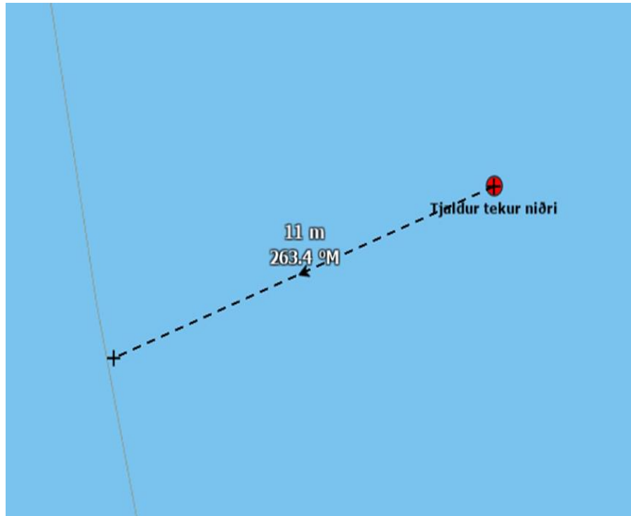
(Mynd 3) fjarlægð að 5 metra jafndýpslínu