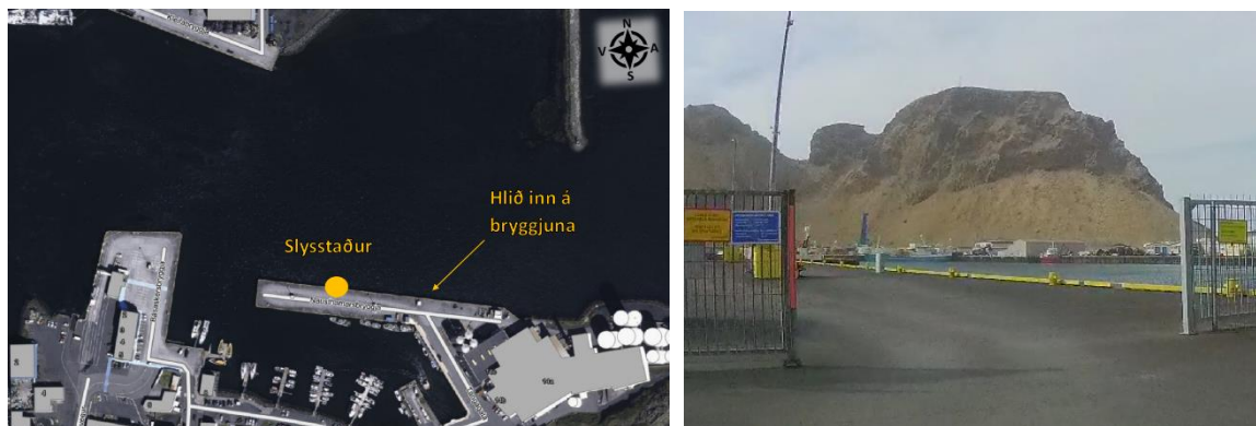
Mynd 3. Samsett mynd sem sýnir slysstað og aðgangshlið inn á bryggjussvæðið.

Bryggjan þar sem slysið varð, Nausthamarsbryggja, er einn af nokkrum viðleguköntum Vestmannaeyjahafnar. Á þeim hluta bryggjunnar þar sem slysið varð var hægt að takmarka umferð með hreyfanlegu hliði. Skilti voru við hliðið með íslenskum og enskum texta þar sem á stóð meðal annars að aðgangur væri bannaður. Á slíkt bann stóð í hafnarreglugerð fyrir Vestmannaeyjahöfn