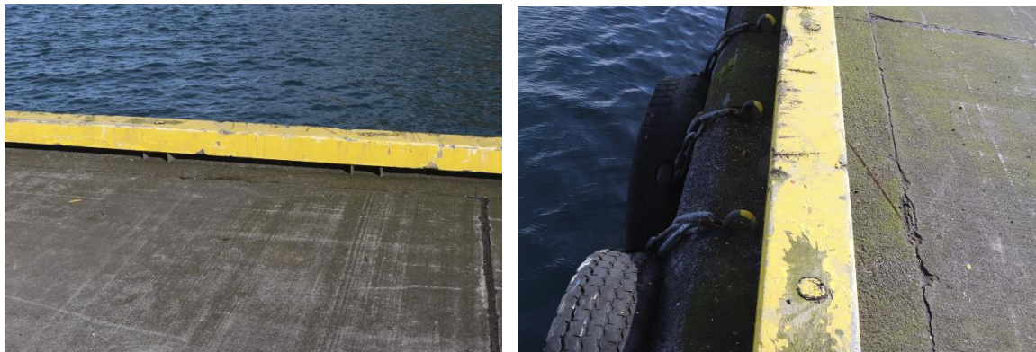
Mynd 4. Samsett mynd. Bryggjukanturinn sem bifreiðin fór yfir.

Yfirborð bryggjunnar var blautt þegar slysið varð. Hiti var um 11°C, hægviðri og skúrir í grennd. Við höfnina voru tvær öryggismyndavélar á upptöku þegar slysið átti sér stað.