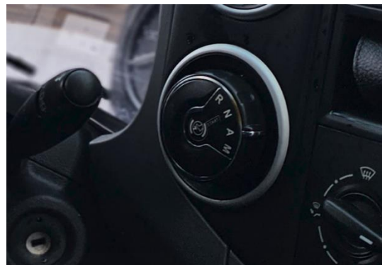
Mynd 2. Samsett mynd. Peugeot bifreiðin á vinstri mynd og stillihnappur fyrir sjálfvirka kúplingu í henni á hægri myndinni.

Bifreiðin var með gilda skoðun þegar slysið átti sér stað og átti næstu aðalskoðun í október 2024. Eigin þyngd bifreiðarinnar var 1399 kg og leyfð heildarþyngd var 2075 kg. Breidd bifreiðarinnar var 1,81 metrar og lengd 4,38 metrar og hún útbúin vetrarhjólborðum. Í bifreiðinni voru tvö framsæti