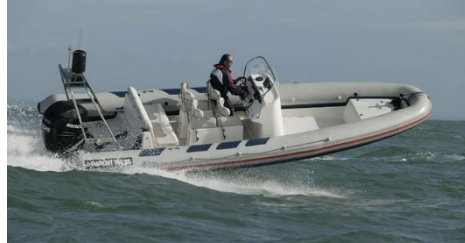
Samskonar bátur @ NN

Gerð: Parker 750 RS Smíðaður: Pólland, 2005, trefjaplast Serial .nr. PL-PAR 75004E 205 Mesta lengd: 7,5 m Skráð lengd: 6,36 m Breidd: 2,75 m Dýpt: Vél: Utanborðsmótor, Mercury, 225 hö Fjöldi skipverja: 1