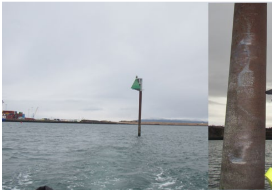
Mynd 5 Staurinn og ákomurnar á honum á innfelldu myndinni