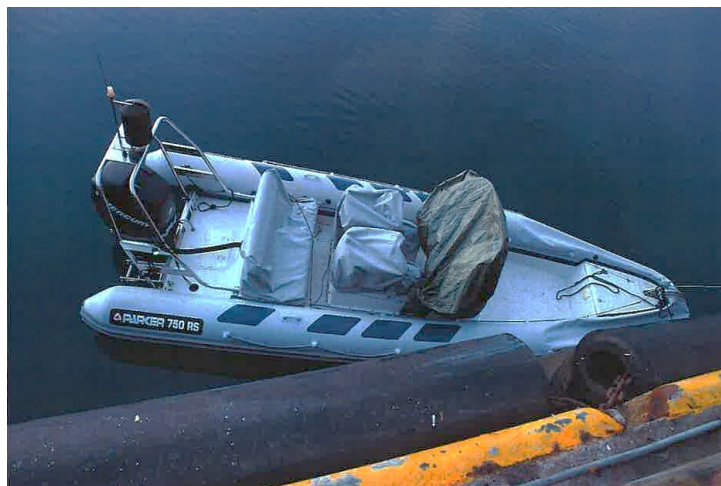
Mynd 1 Báturinn við Vogabakka

Menn sem þekktu til viðgerðaraðilans fóru að lengja eftir honum og hófu að svipast um eftir honum um stund á bátalæginu og við viðlegukanta þegar hann hafði ekki skilað sér. Fóru þeir síðan til leitar á bát út frá Snarfarahöfn og fundu þeir bátinn mannlausan í gangi við bryggju Samskipa við Vogabakka. Höfðu þeir þá samband við lögreglu en þá var kl. 01:17 (Sjá mynd 1). Nokkrar ákomur voru á bátnum og slöngur rifnar að framan.